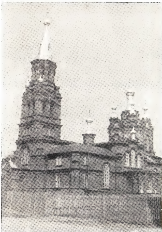
ЗНАМЕНСКИЙ ХРАМ в г. ОСТАШКОВЕ